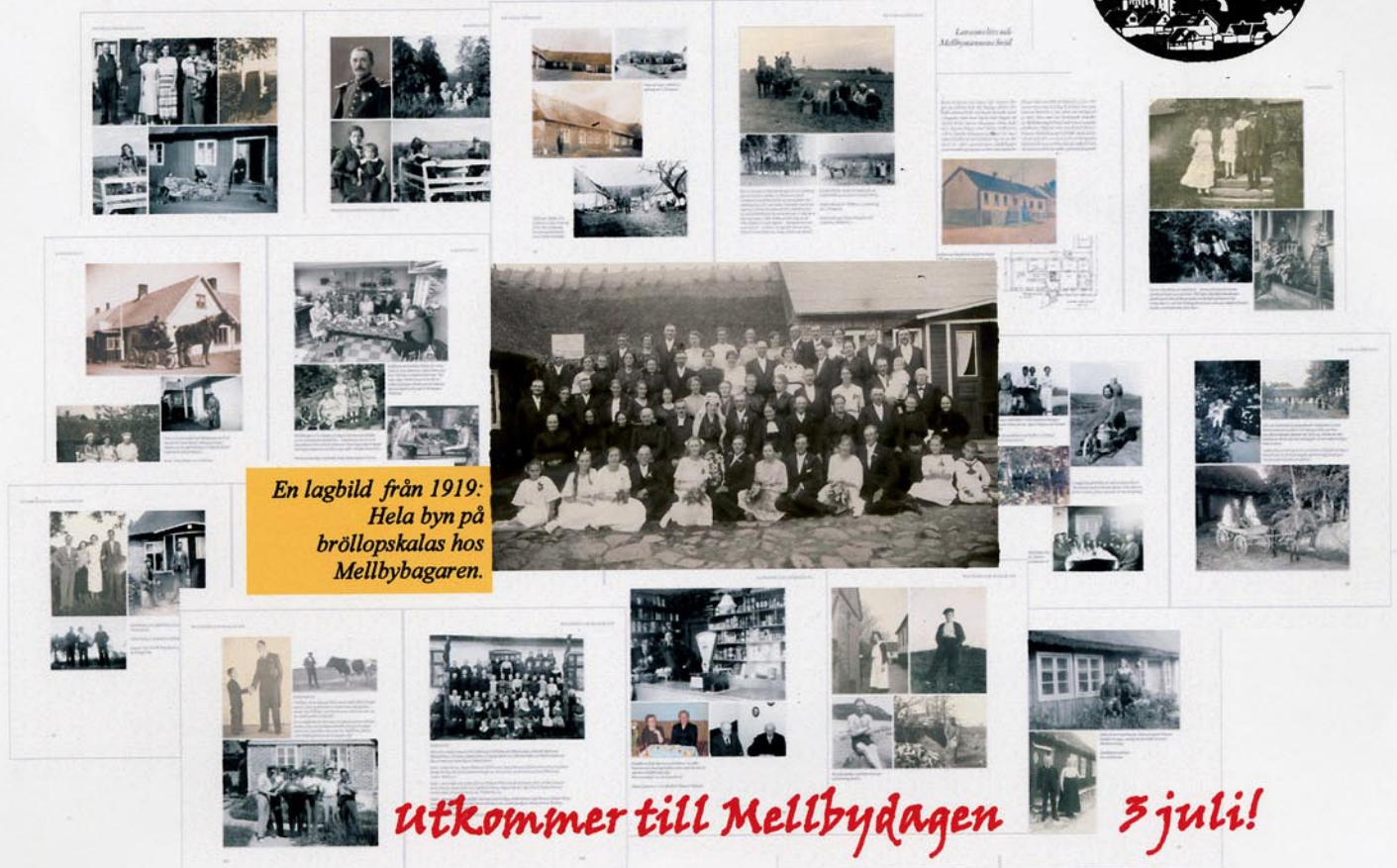
En lagbild från 1919: Hela byn på bröllopskalas hos Mellbybagaren.